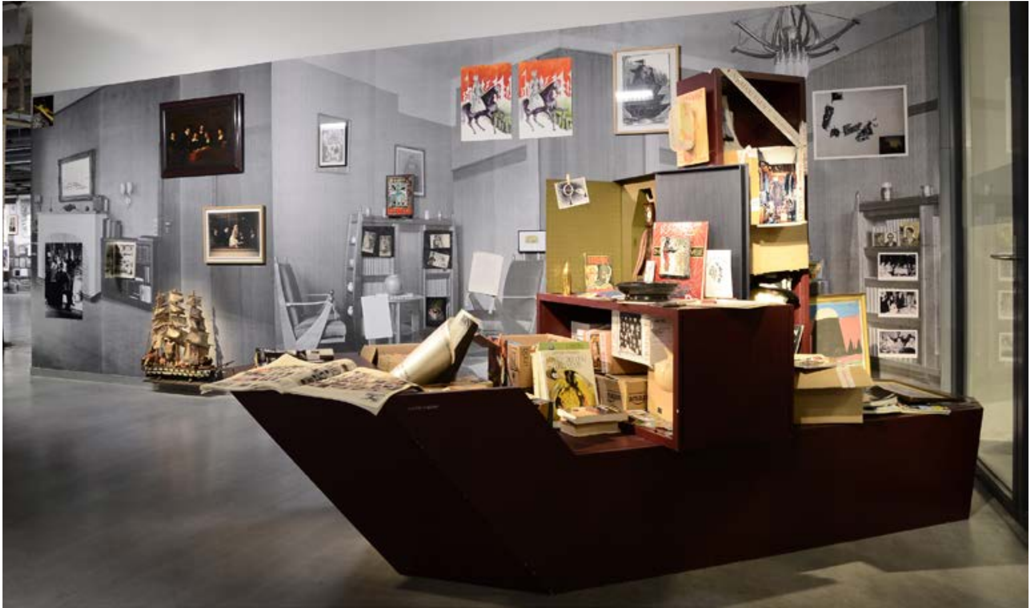
Vrai ou Faux? - 2013 - Netherland Fotomuseum - Rotterdam - Pays bas - 280x500cm Pièce unique - Techniques mixtes - (Bibliothèque bateau de matali crasset/courtesy : Royal Book Lodge mis en scène par V.Bourgoin) Salon Hollandais