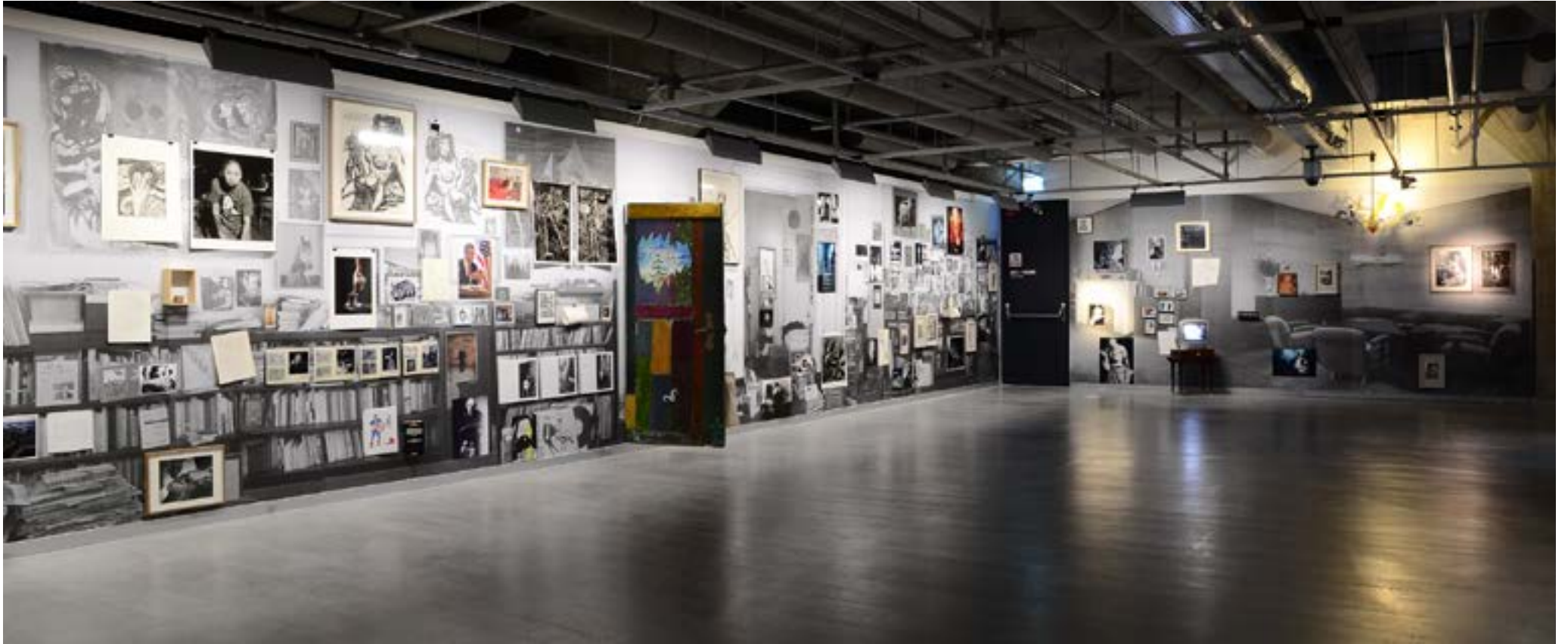
Vrai ou Faux? - 2013 - Netherland Fotomuseum - Rotterdam - Pays bas 1600x600x280cm - Pièce unique - Techniques mixtes Salon Allemand et salon Hollandais