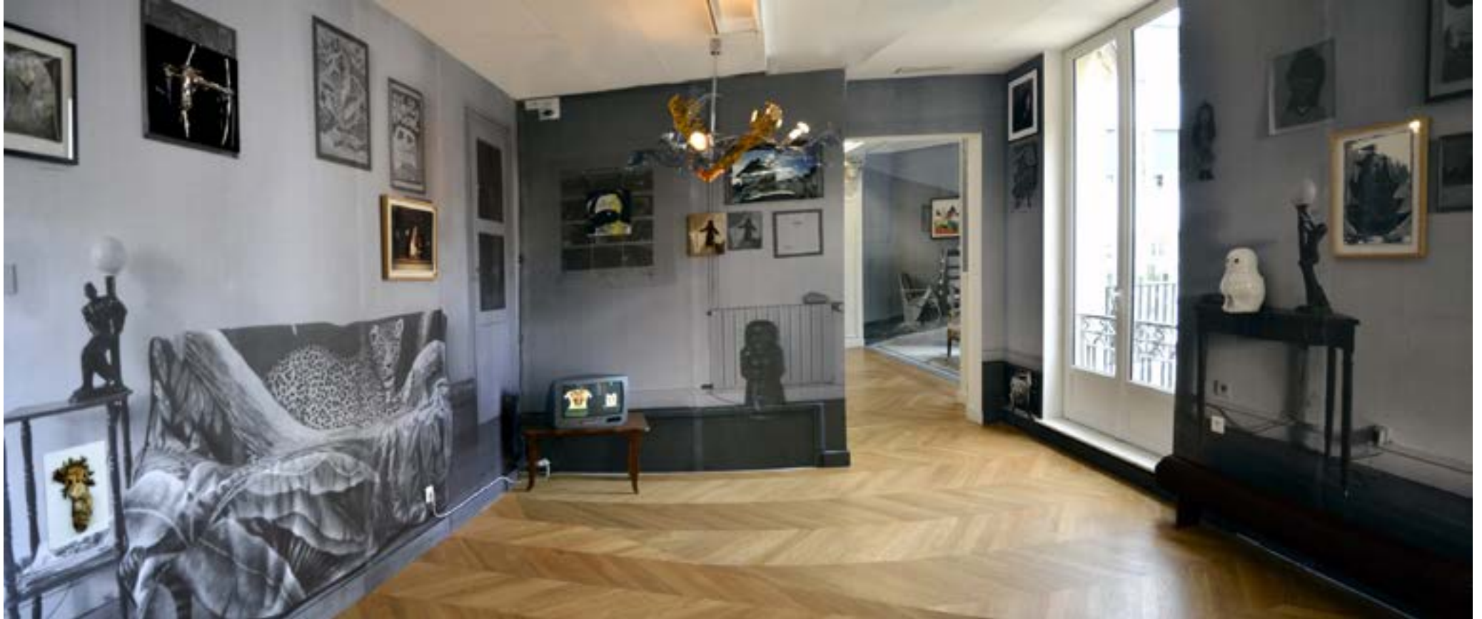
Salon Cosmos - 2014 - Le 116, Centre d'Art Contemporain, Montreuil, France Vu d'ensemble - Pièce unique - Techniques mixtes Salon Montreuillois