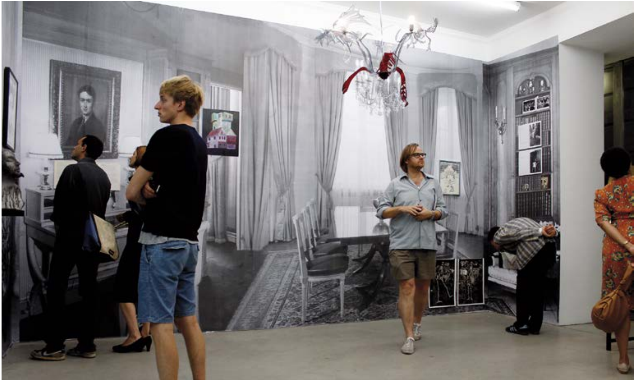
Vrai ou Faux? - 2011 - Galerie Gaby Seen - Vienna, Austria - 300x800cm - Pièce unique - Techniques mixtes Salon Viennois