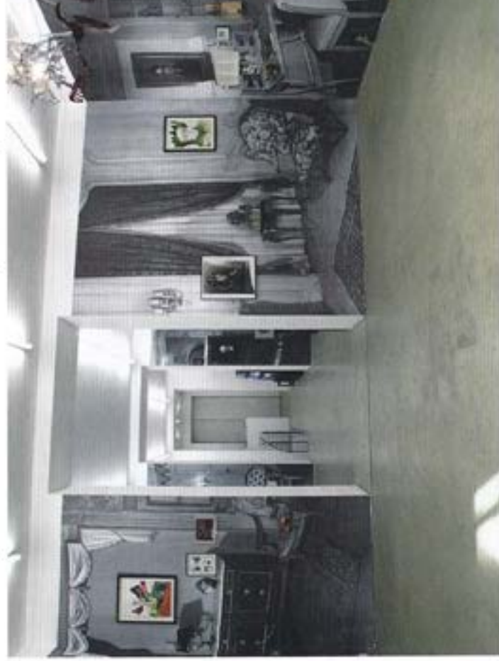
Anstellungsansicht »Vral ou Faux«, Gabrielle Stern Galerie, Wien 2011