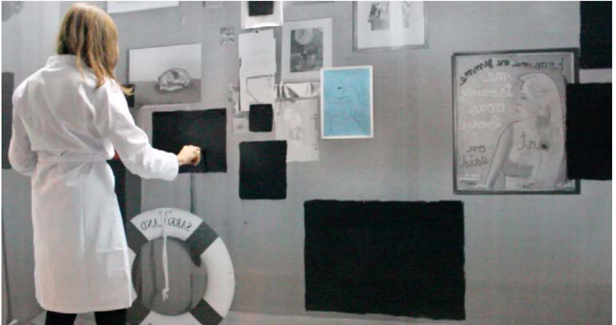
Trailer - 2015 - La Gad, Printemps d'Art Contemporains, Marseille, France Action painting/performance de finissage