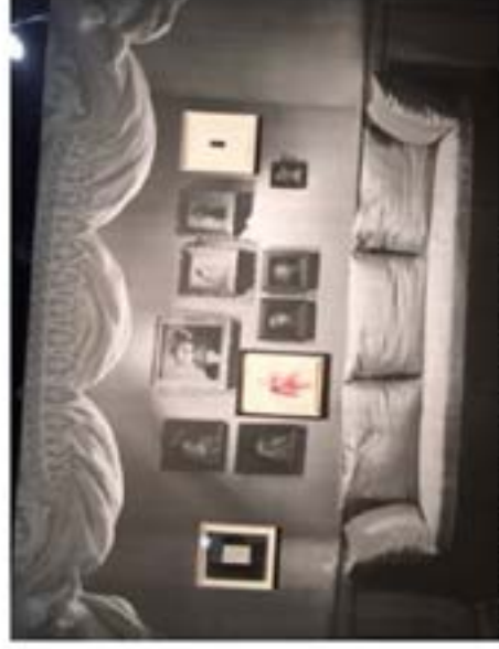
Vernissage Bourgois Salon Aubry, 2015, (Galerie Deborah Schamoni)

PAR JUDITH BENHAMOU | 26/08/2015 | 18:52