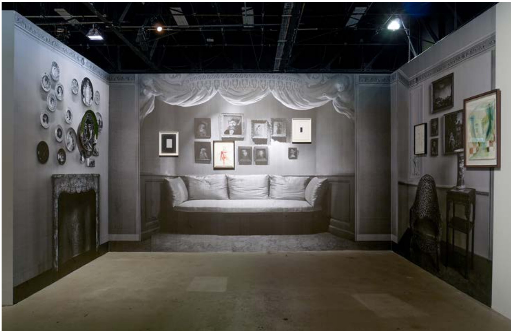
Labyrinthe du temps - 2015 - Art O Rama, Galerie Deborah Schamoni/Munich, Marseille 250x500x320x280cm - Pièce unique - Techniques mixtes Salon Borely