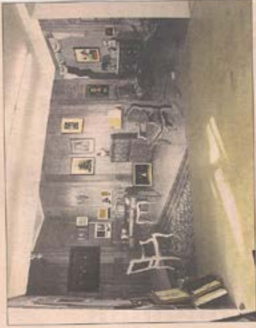
Ausstellung „Vrai ou faux?“ in der Galerie Senn.

Bis 5. 11., Galerie Senn Schiefmühlgasse 1a, 1040 Wien www.galeriensenn.at