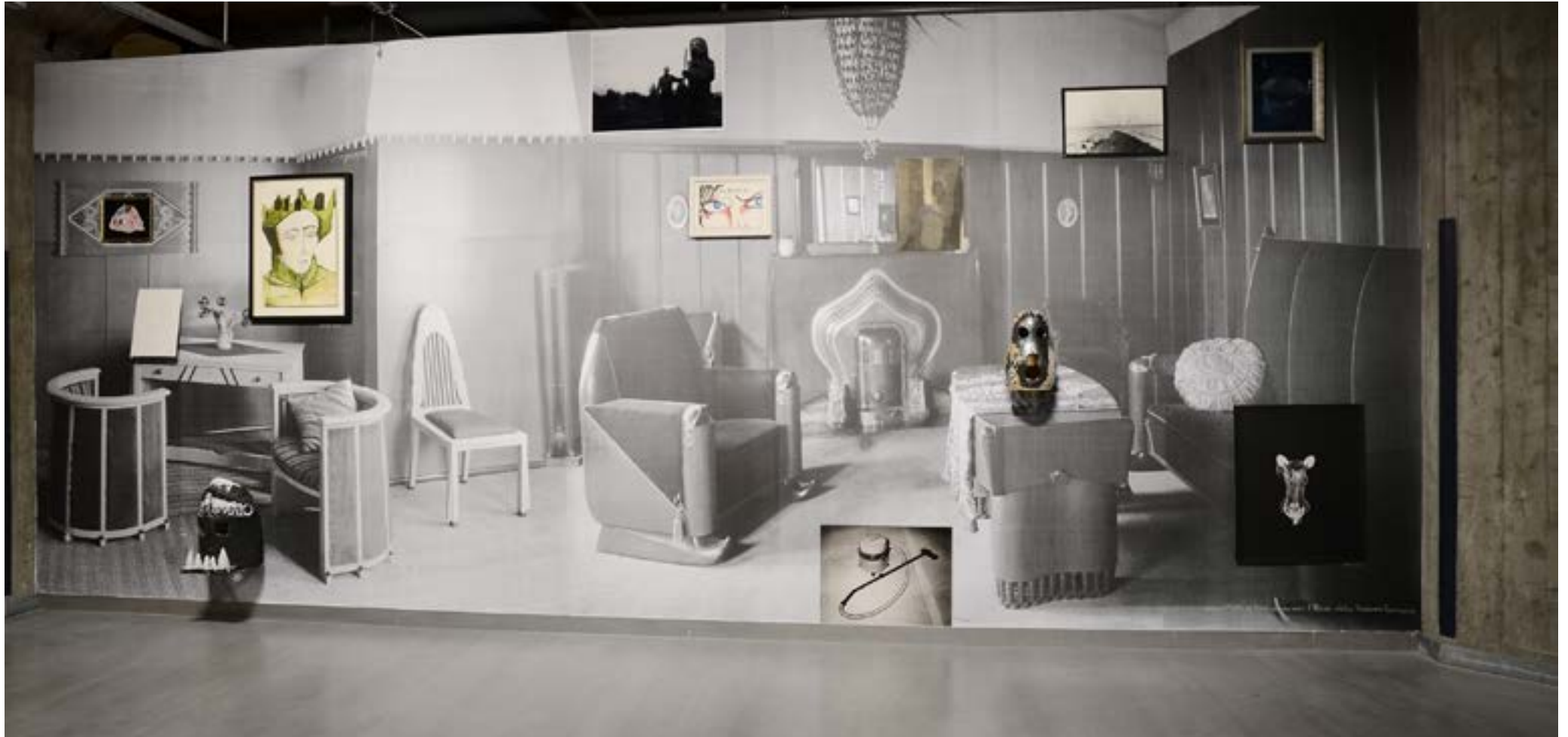
Vrai ou Faux? - 2013 - Netherland Fotomuseum - Rotterdam - Pays bas 280x500cm - Pièce unique - Techniques mixtes Salon Hollandais