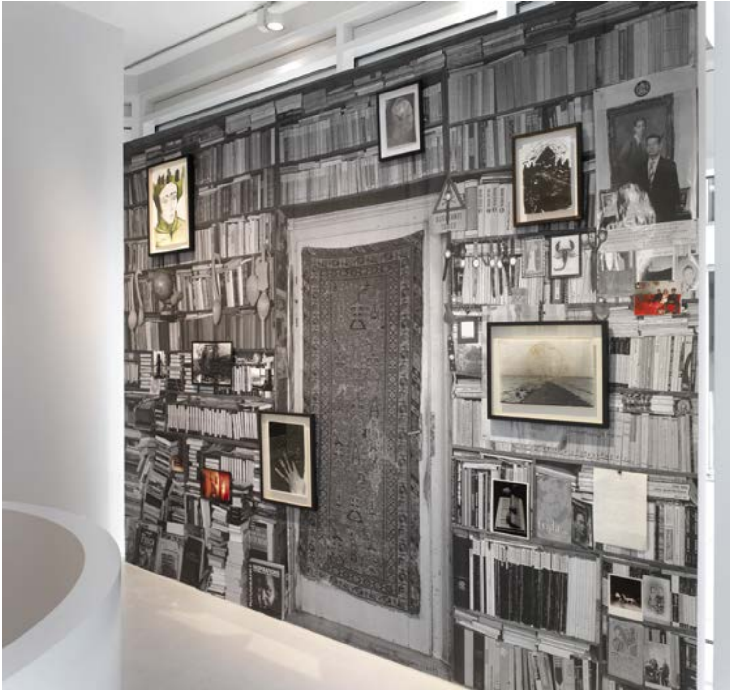
Extented Place - 2013 Setareh gallery, Dusseldorf, Allemagne 300 x 400cm - Pièce unique - Techniques mixtes Salon Roumain