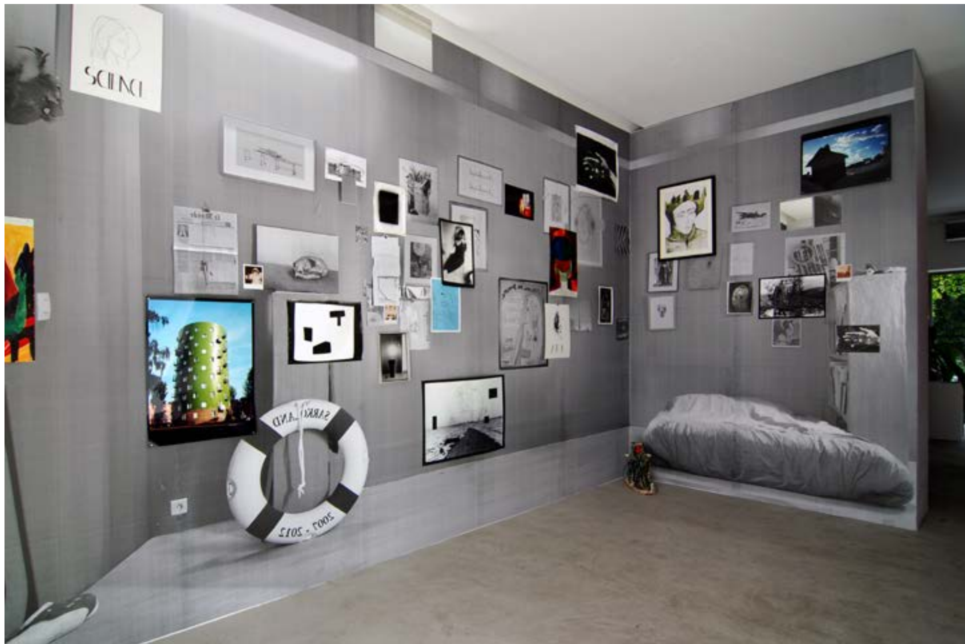
Trailer #1- 2015 - La Gad, Printemps d'Art Contemporains, Marseille, France 300x 480x270cm - Pièce unique - Techniques mixtes Salon Marseillais crée in situ