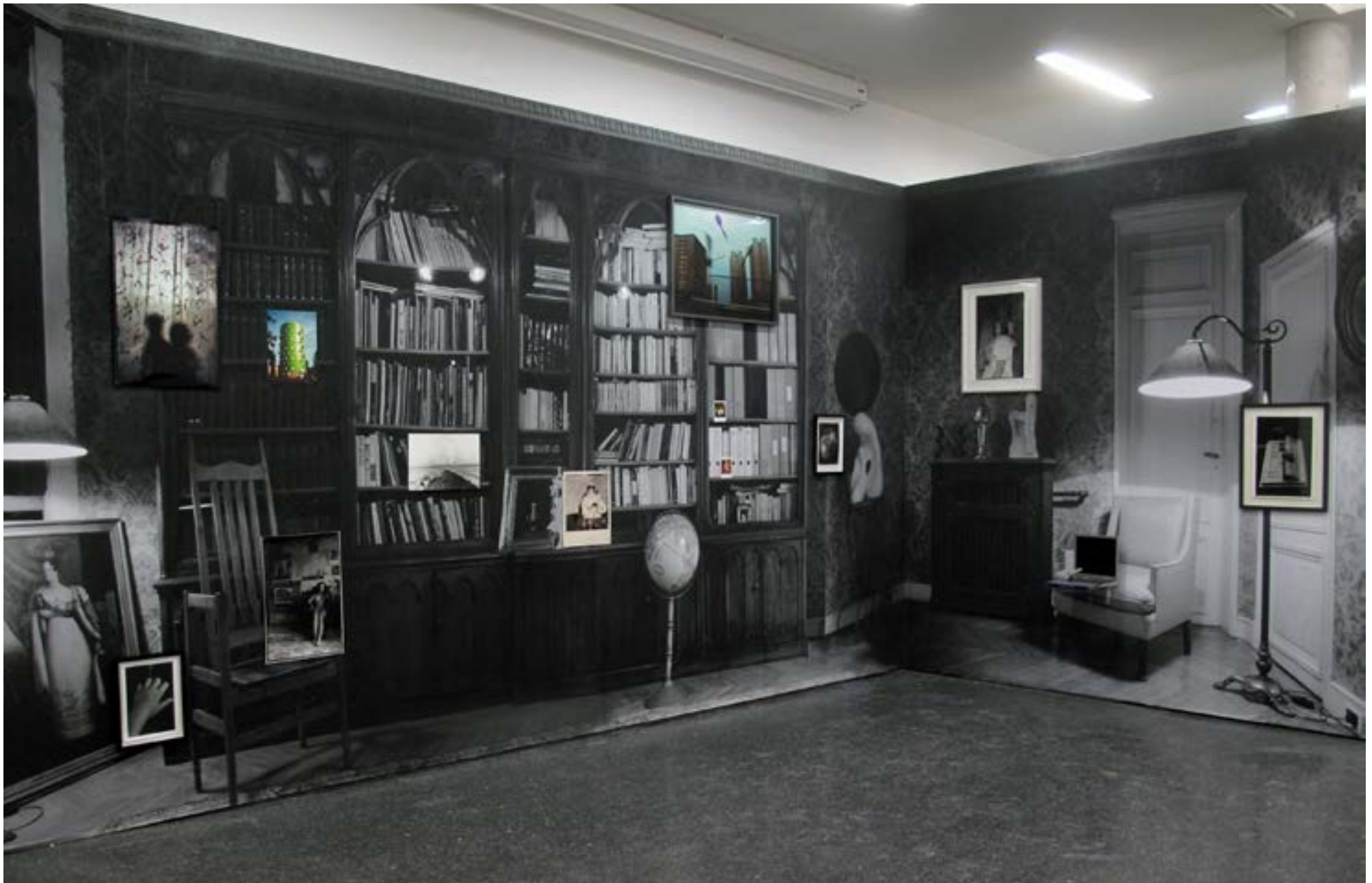
Labyrinthes du temps - 2015 - Fotohof, Salzburg, Austria 3 00x 580x320cm - Pièce unique - Techniques mixtes Salon libanais