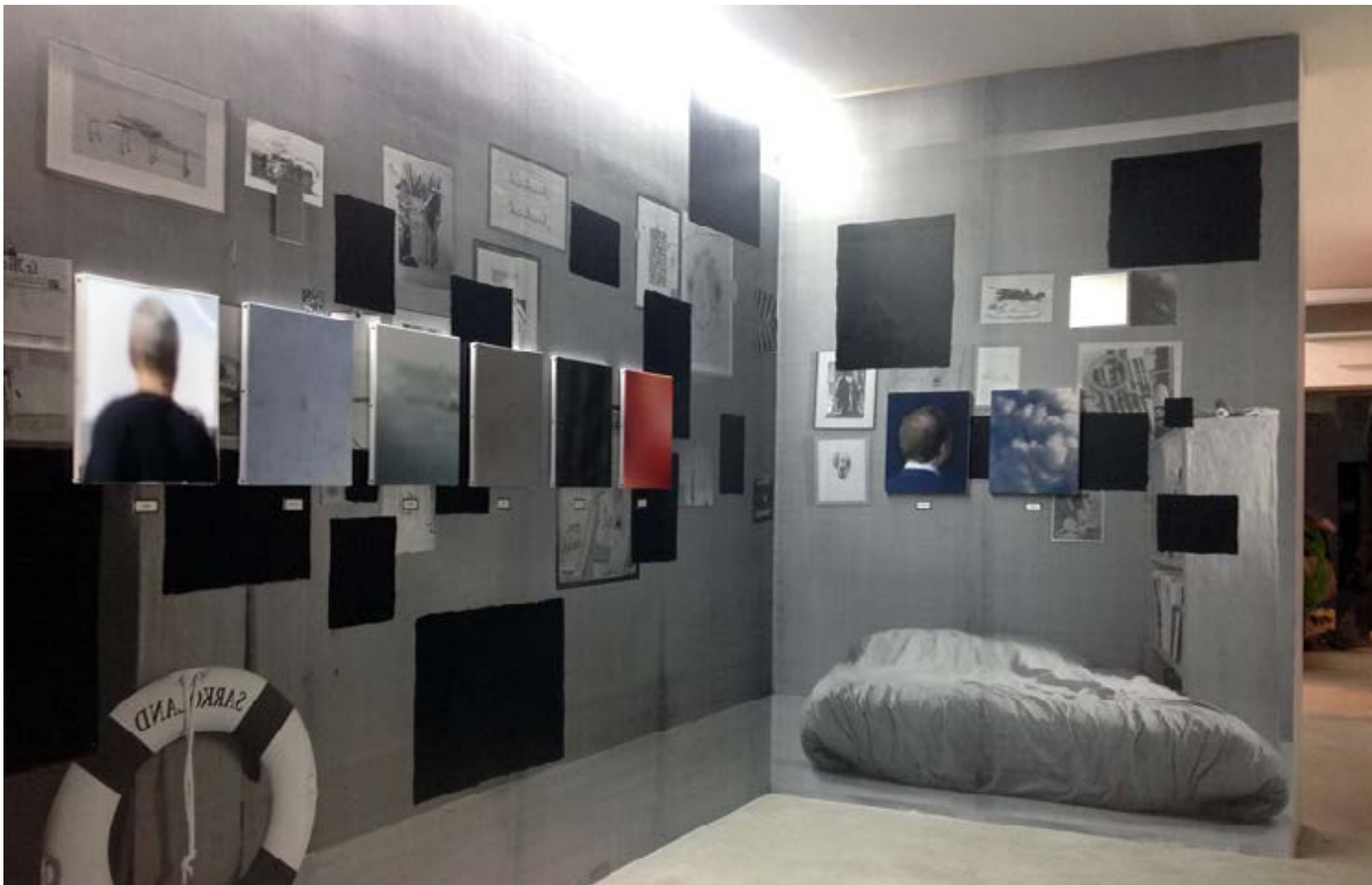
Trailer#2 - 2015 -La Gad - Festival Photographie Contemporaine, Marseille, France 300x480x270cm - Pièce unique - Techniques mixtes Salon Marseillais crée in situ