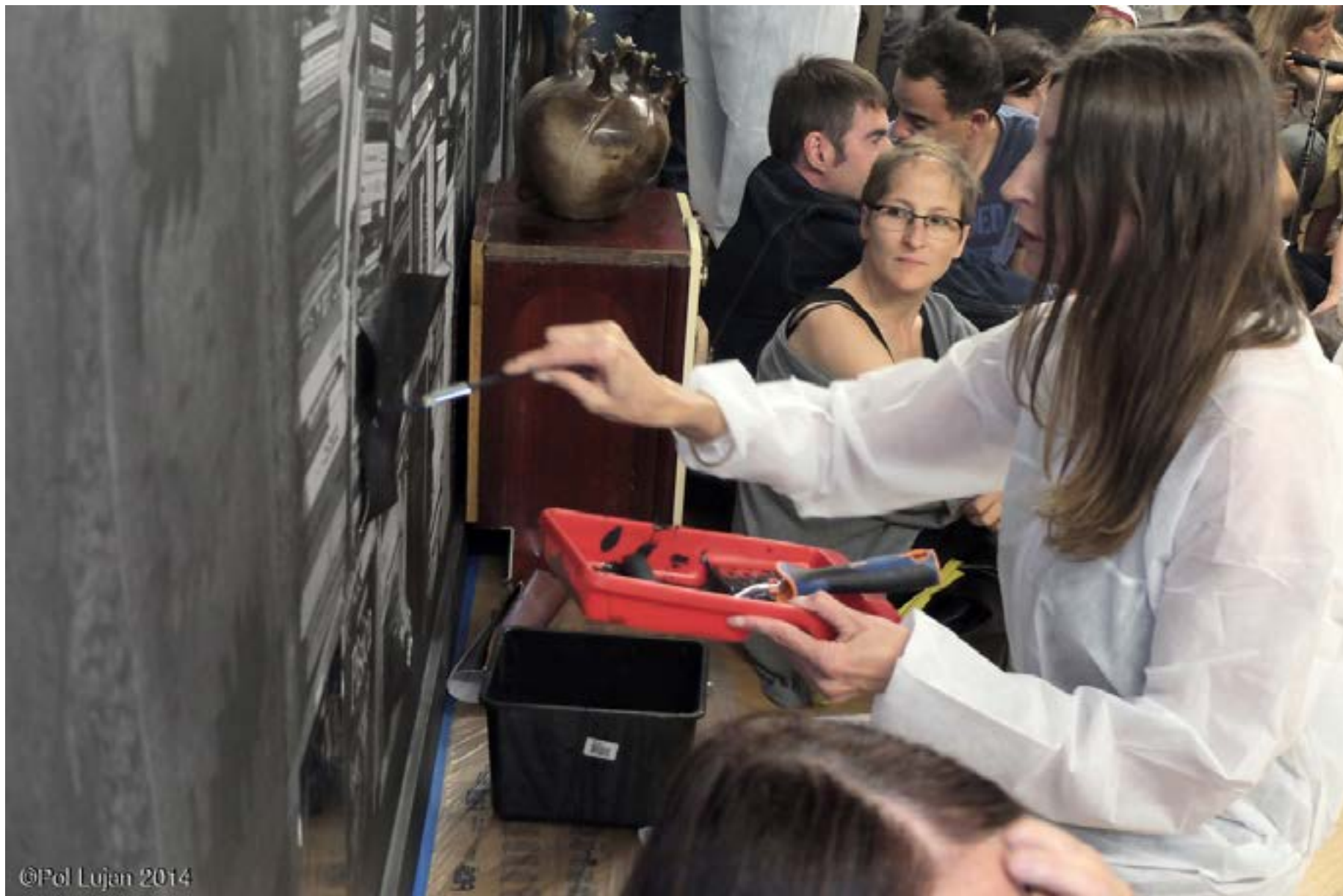
Salon Cosmos - 2014 - Le 116, Centre d'Art Contemporain, Montreuil, France Action painting/performance de finissage