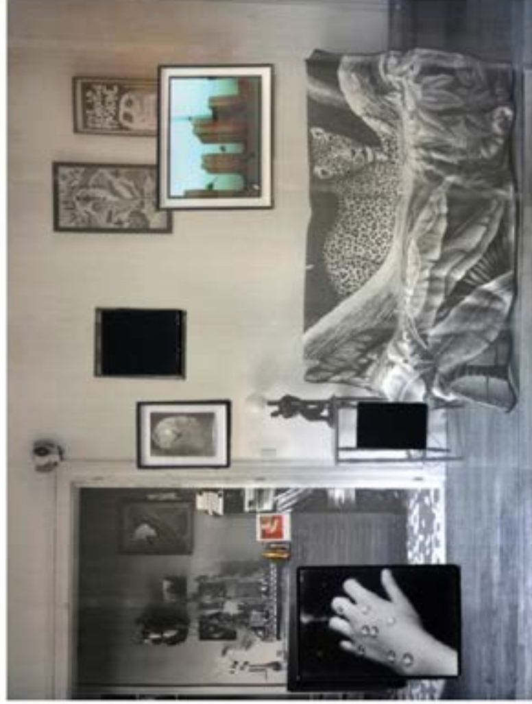
Deborah Schamoni gallery, Munich. Veronique Bourgoïn, Vue d'exposition "Salon Cosmos" (Le 116, Montreuil)

29 – 30 Aug 2015 at La Cartonnerie in Marseilles, France