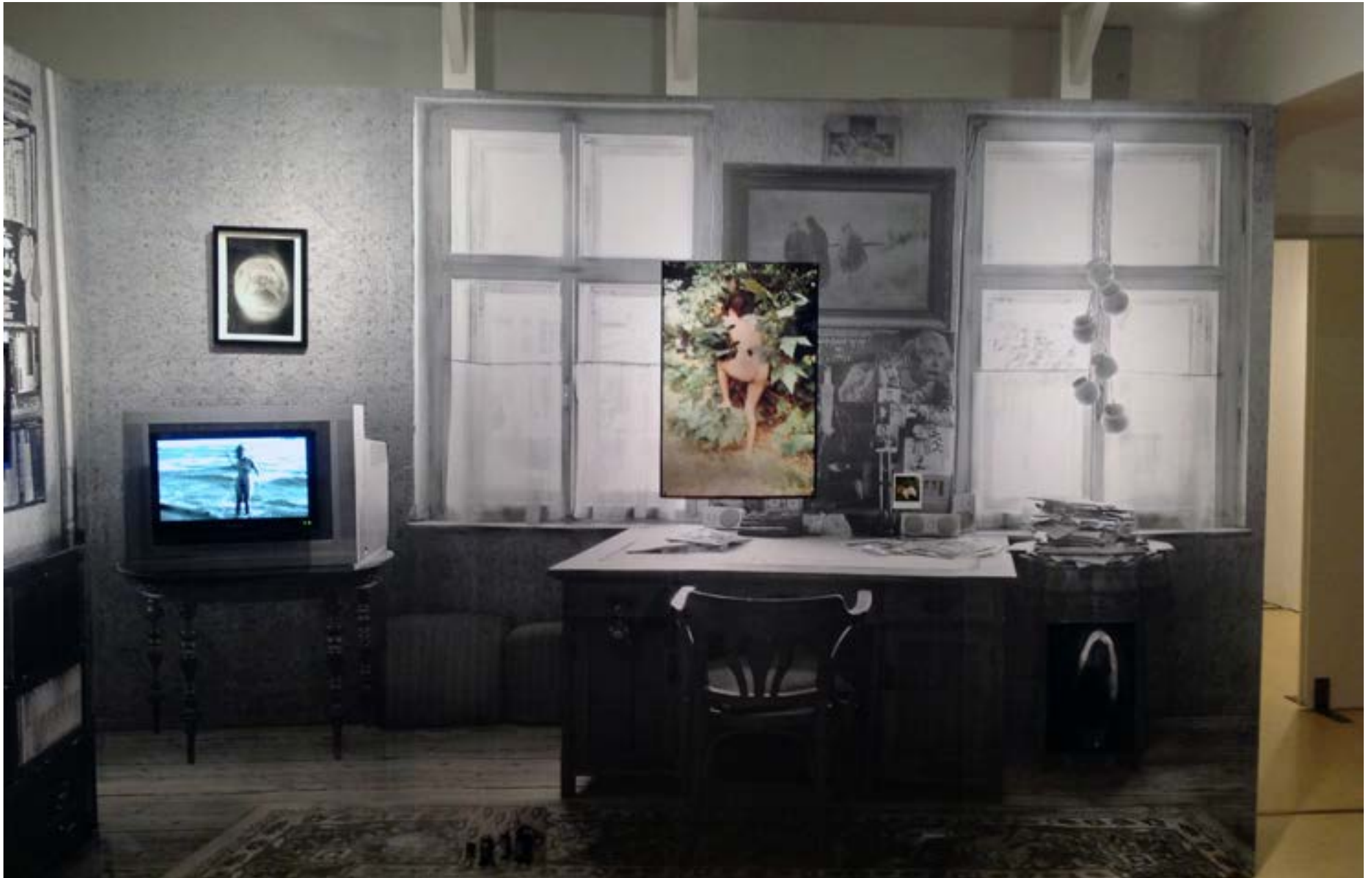
Labyrinthe du temps - 2015 - Landskrona Photo Festival, Landskrona, Sweden 250x400cm - Pièce unique - Techniques mixtes Salon Roumain