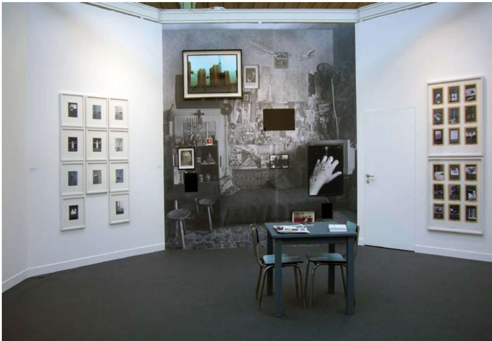
Salon 2° - 2014 - Paris Photo 2014 - Grand Palais - Galerie Eva Meyer 350x300cm - Pièce unique - Techniques mixtes